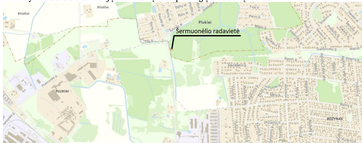
2. pav. Šermuonėlio radavietė

Atlikus „Buveinės tinkamumo šermuonėliui įvertinimas būsimo Šiaurinės gatvės (nuo Pramonės g. iki Smėlynės g.) teritorijoje Panevėžio mieste“ įvertinimą žr. (5 priedas) nustatyta, kad Rožyne esanti būsimo Šiaurinės gatvės teritorija per 30 metų po pirmos ir paskutinės šermuonėlio registracijos yra pasikeitusi. Nors mitybinė bazė natūraliose teritorijos dalyse – pievose ir medžiais apaugusiose vietose – galėtų būti pakankama, natūralių šlapių buveinių stoka ir trikdymas daro šia teritoriją netinkamą retai plėšriųjų žinduolių rūšiai.