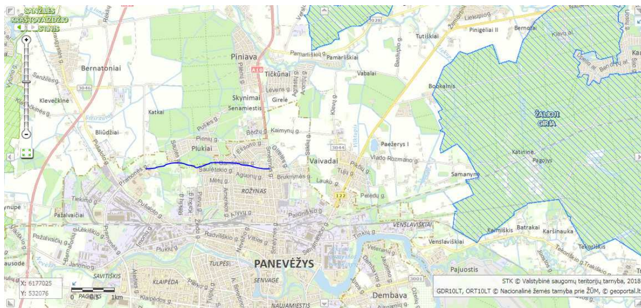
1. pav. Projektuojamos gatvės išsidėstymas saugomų teritorijų atžvilgiu

22. Informacija apie saugomas teritorijas (pvz., draustiniai, parkai ir kt.), įskaitant Europos ekologinio tinklo „Natura 2000“ teritorijas, kurios registruojamos STK (Saugomų teritorijų valstybės kadastras) duomenų bazėje ( http://stk.vstt.lt ) ir šių teritorijų atstumus nuo planuojamos ūkinės veiklos vietos (objekto ar sklypo, kai toks suformuotas, ribos). Pridedama Valstybinės saugomų teritorijos tarnybos prie Aplinkos ministerijos Poveikio reikšmingumo „Natura 2000“ teritorijoms išvada, jeigu tokia išvada reikalinga pagal teisės aktų reikalavimus.